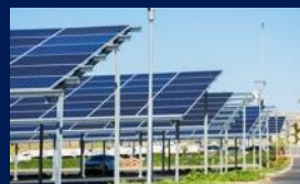
Ombrières de parking